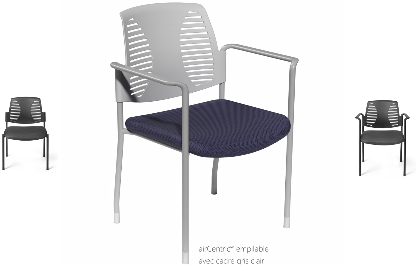
airCentric MC empilable avec cadre gris clair

La chaise empilable airCentric MC offre une esthétique moderne avec un dossier unique à flux d'air qui complète le design du fauteuil travail ergonomique airCentric 2.